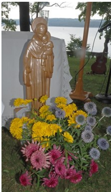
Statue de Notre Dame des Foyers de Charité

« Être affiliée à vie est un bien précieux pour moi.